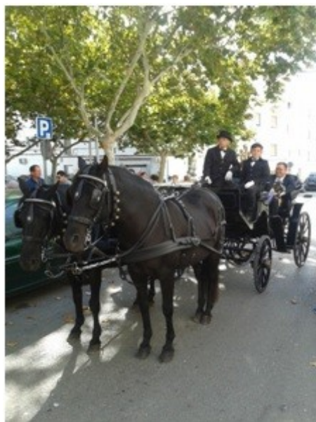
Figura 2. Entrada de la Virgen de Gràcia en Maó

Esta consideración de las fiestas populares como un todo sistémico implica tener en cuenta cómo las rivalidades políticas y sociales se manifiestan pese a la consideración tradicional de las mismas como esferas neutrales separadas. En el caso de las Festes de Gràcia , este intento de idealización y desconflictivización de las fiestas se manifiesta, incluso, en los saludos que, desde el Ayuntamiento, realizan los alcaldes y alcaldesas de la ciudad y que son publicados en los programas de fiestas. Así, y a modo de ejemplo, el relativo al año 2000 invitaba a disfrutar de las fiestas en “ pau i sana convivència ” (Ajuntament de Maó, 2000, p. 4), mientras que el del año 2018 señala las mismas como “la culminación cultural y lúdica de todo aquello que sentimos como pueblo” (Ajuntament de Maó, 2018, p. 3). Sin embargo, este llamamiento a la unidad no amaga ciertos conflictos que se hacen patentes en el espacio urbano del municipio.