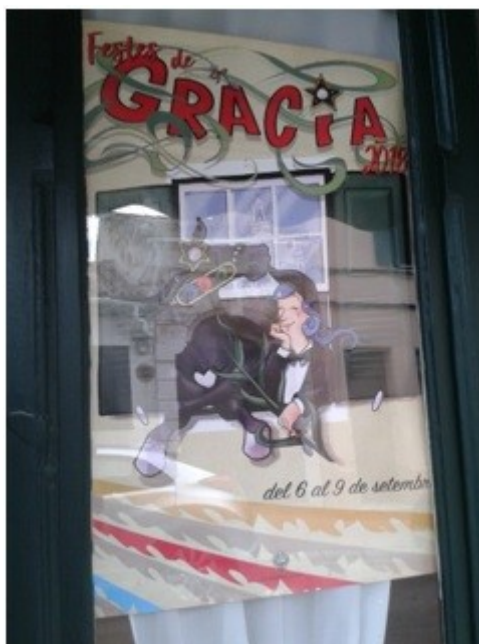
Figura 3. Programa de las Festes de Gràcia 2018

aquí, indignada porque el Ayuntamiento había diseñado un cartel si ningún motivo religioso” 8 (ver Figura 3).