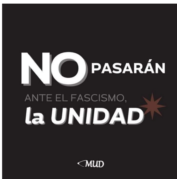
Figura 1. Fotografía: Ante el fascismo, la unidad

Focalizando la mirada en esta red de mayores adeptos, las publicaciones de la asociación reciben pocos comentarios (promedio=2) y más bien proliferan los likes (promedio=40) en comparación a “ los compartir ” (promedio=21). La publicación más comentada con 188 comentarios y 356 likes analiza el curriculum laboral del nuevo Ministro de Educación, mientras que la que capturó mayor atención concentró 842 likes junto con 16 comentarios y se vinculó con campaña comunicacional de sensibilización de las implicancias de la elección de un gobierno de ultraderecha-fascista (MUD, 2022 [ver figura 1]).