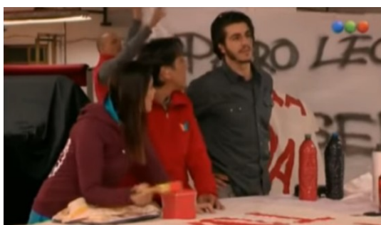
Figura 17. Fotograma de La Leona