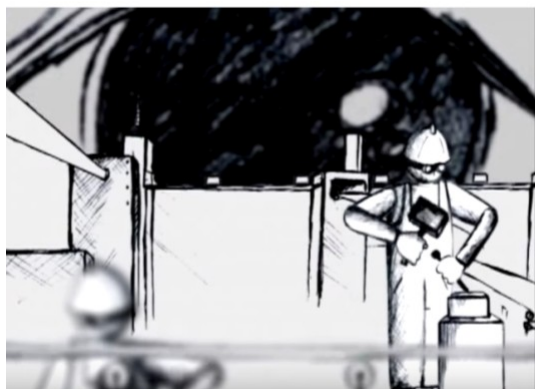
Figura 1. Fotograma de No retornable