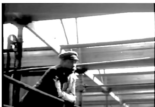
Figura 2. Fotograma de I Compagni (Cristaldi y Monicelli, 1963), insertado en el documental No retornable