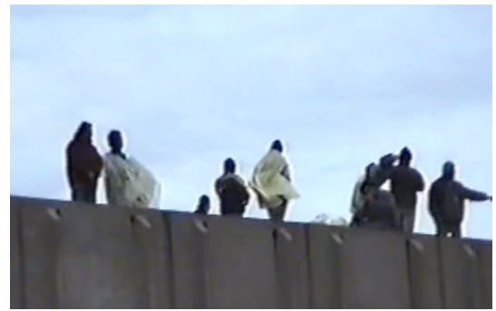
Figura 13. Fotograma de Mate y Arcilla, Zanón bajo control obrero

Esta identificación y orgullo con la labor de cada día en la fábrica, que incluso existía antes de su ocupación, ahora con la autogestión se revaloriza. Esto puede verse también en No retornable (Cáceres, y Parisotto, 2007)