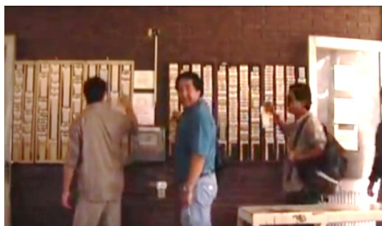
Figura 9. Fotograma de Fasinpat, Fábrica Sin Patrón

El primer motivo visual que rastreamos como parte de este imaginario del amor al trabajo , de una cosmovisión que permite construir una resistencia a la opresión e imaginar vínculos afectivos y de afición con el mundo laboral, con la actividad que desarrollan estos trabajadores de manera autogestionada y sin patrones es, precisamente, el ingreso a la fábrica, a través de fichar el horario de entrada, donde la fábrica misma es representada como espacio de pertenencia y de identidad laboral en los documentales. Es el momento de iniciar la jornada laboral, el lugar de reencuentro con los compañeros, el ingreso al espacio de trabajo. En estos casos, que son registrados luego de la ocupación y recuperación de la fábrica, se ven trabajadores sonriendo, relajados, con deseos de entrar al espacio fabril y de compartir el día junto a sus compañeros, a diferencia de lo que mencionamos previamente con las imágenes retratadas por Farocki sobre la huida de la fábrica.