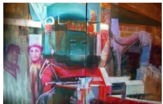
Figura 15. Fotograma de De guerreros y maestros