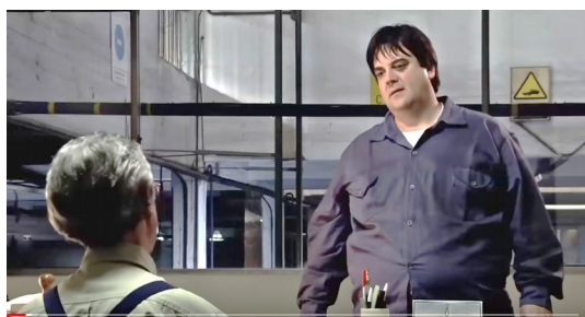
Figura 3. Fotograma de Industria Argentina, la fábrica es para quienes trabajan

visualiza una escena de la película italiana I Compagni (Cristaldi y Monicelli, 1963), dirigida por Mario Monicelli, en la cual el capataz vigila, desde lo alto, a los trabajadores ubicados en la planta baja de la fábrica.