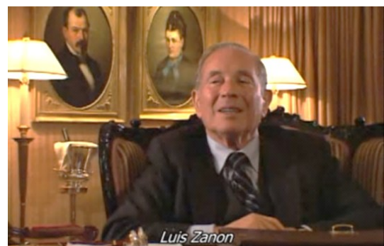
Figura 6. Fotograma de Mate y Arcilla , Zanón bajo gestión obrera