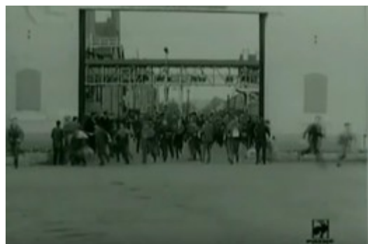
Figura 8. Fotograma de Trabajadores saliendo de la fábrica . Obreros salen corriendo de una fábrica de Lyon en 1957

Por último, el tercer motivo visual es el que da cuenta más clara y cabalmente del desapego con relación a la fábrica. Nos referimos a la huida del lugar de trabajo: la salida apresurada, casi en estampida, que ha sido registrada en muy diversas imágenes, en su mayo-