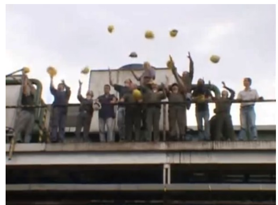
Figura 14. Fotograma de La Toma/The Take