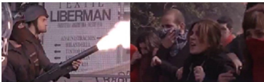
Figura 11. Fotograma de La Leona . Desalojo de Textil Liberman

En estos casos, puede verse en La Leona (Echarri et al., 2016), a la protagonista María Leone, detrás del portón de rejas de la fábrica que divide a los trabajadores de los policías. La protagonista femenina será, en palabras de Libertad Borda y Ramiro Lehkuniek (2016), una luchadora de carácter inquebrantable que no duda en enfrentar a quien sea para defender lo que considera justo y la primera heroína de telenovela que es reprimida por la policía (ver figura 11). También imágenes similares de la represión policial se repiten en Industria Argentina (Sánchez Sotelo e Iacoponi, 2012): se muestra a los trabajadores fuera de la fábrica, pero ocupando la vereda con carteles, mesas y banderas, cuando llegan los fiscales y la policía que los intenta desalojar.