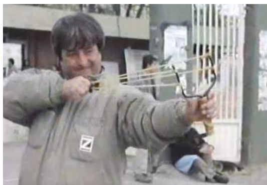
Figura 12. Fotograma de Fasinpat, Fábrica Sin Patrón

Las puertas de la fábrica estructuran la formación de los obreros y las obreras reunidos por el orden del trabajo y esta compresión produce la imagen de un proletariado (...) Sin embargo, los obreros se transforman en individuos ni bien cruzan el portón: esa es la parte de sus vidas que recupera la mayoría de las películas de ficción. (Farocki, 2013, p. 197)