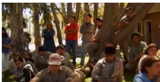
Figura 16. Fotograma de Fasinpat, Fábrica Sin Patrón . Reunión en asamblea, bajo los árboles, en el predio exterior de la fábrica