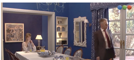
Figura 7. Fotograma de La Leona

En las ficciones, tanto en la serie La Leona (Echarri et al., 2016) como en la película Industria Argentina, la fábrica es para quienes trabajan (Sánchez Sotelo e Iacoponi, 2012), se le otorga más espacio que en los documentales a la reconstrucción de la figura del patrón y se matiza, incluso, este perfil psicológico de empresario inescrupuloso. Aquello que es relatado por los trabajadores en algunos de los documentales como en Corazón de Fábrica (Molina y Ardito, 2008), o que es mostrado elíptica y metafóricamente en otros, como en Fasinpat (DI Producciones e Incalcaterra, 2004) o en No retornable (Cáceres y Parisotto, 2007), al ser ficcionalizado adquiere rostro y personalidad, suscita incluso contradicciones, pena, identificación con los espectadores, además de enojos. Este es el caso del personaje de Klaus Miller, dueño de la Textil Liberman en La Leona (ver figura 7).