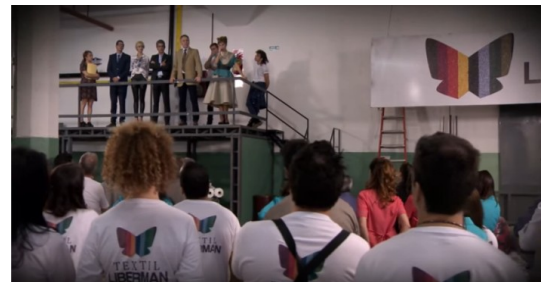
Figura 4. Fotograma de La Leona

Continuando con el análisis del patrón en tanto motivo visual, el documental Mate y Arcilla (Alavio et al., 2003) pone en escena y da voz a Luigi Zanón, dueño de la empresa de cerámicos, la mayor de América Latina. Zanón aparece siendo entrevista-