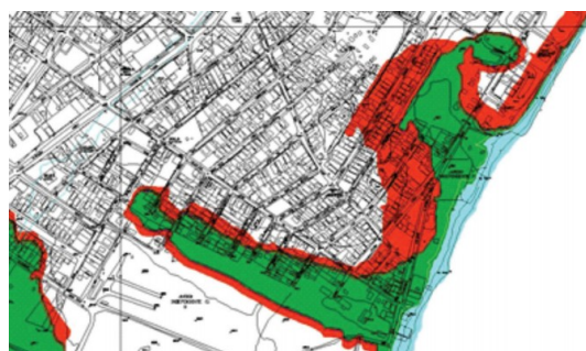
Figura 2. Zona central del municipio y áreas que están siendo inundadas

A estos hechos hay que añadir los impactos ecológicos, medio ambientales y sociales de este tipo de proyectos, incrementados por la llegada de miles de trabajadores temporarios para la realización de las obras ( barrageros ) procedentes de otras regiones y estados del país. Esta situación se suma al crónico y grave déficit habitacional, de infraestructuras y de sistemas de tratamiento de aguas residuales y de falta de agua corriente en los municipios de la región. Estos impactos no serán los únicos, sino que representan tan solo una parte visible, apareciendo otros menos visibles en los ámbitos cultural, social, y administrativo en el municipio y que desencadenarán procesos a largo plazo más profundos de cambio en la región y en los municipios afectados (ver figura 2).