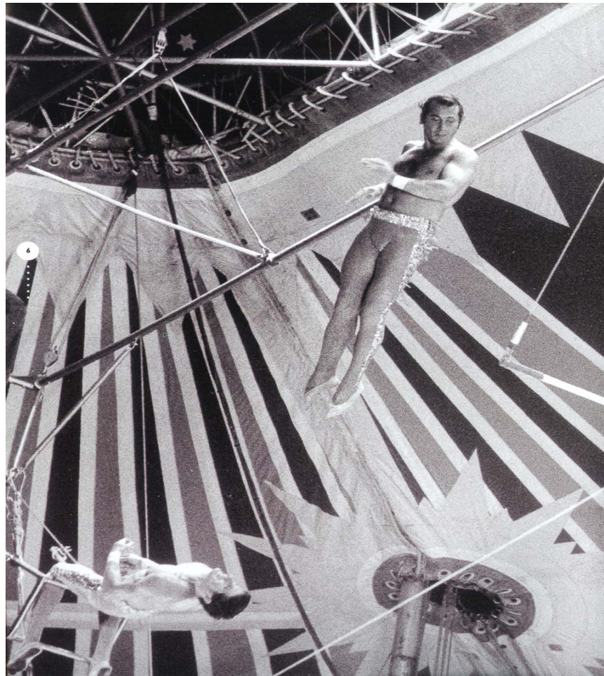
Fig. 1- Paul de Cordon, “Retour pirouette d’Enzo Cardonas”, 1973.