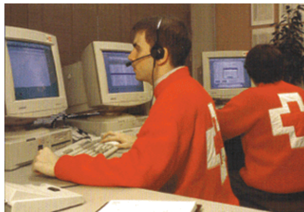
Operadores del servicio de TAD de la Cruz Roja