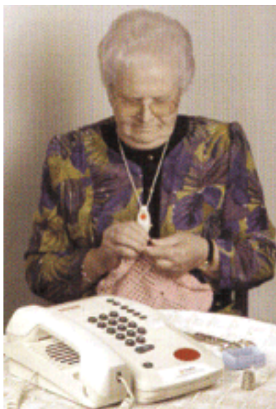
Usuaría del servicio de TAD de la Cruz Roja con equipo

Estos servicios utilizan sistemas de alarma personales y teléfonos de emergencia que ponen en contacto de forma automática al usuario con el centro asistencial con solo pulsar un botón. El operador del centro escucha la demanda del usuario y en función de los datos de que dispone (datos personales, diagnósticos clínicos, tratamientos seguidos, medicación actual, profesionales que lo asisten, personas cercanas, etc.) toma la medida oportuna. Éste es el servicio de tele-asistencia que se está implementando en el Estado español.