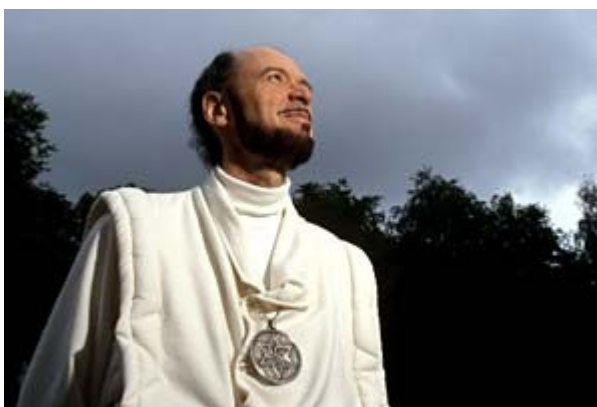
Ilustración 4. Su Santidad Raël

procedimientos de síntesis bioquímica in vitro y tras un largo viaje intragaláctico llegaron a la Tierra hace millones de años para plantar la semilla de la vida inteligente.