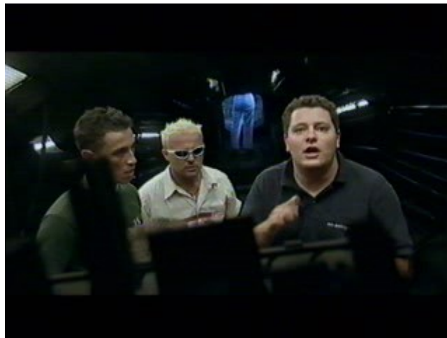
Ilustración 9. El Gran Marciano : "¡Yo quiero-ir-me-a-Martel!"

Luego, otra vez, el aterrador aliento de la masa telefónica (La Audiencia Ha Decidido) sobre mi cogote. Escapar, escapar, escapar; tengo que escapar a la humillación concursal definitiva, arrojar la toalla antes de que suene la campana. Mi ceremonia improvisada de rendición, sacrificio y salvación nocturna fue también emitida en directo, algunos lo recordarán: "Ya estoy preparado: casco de espeleólogo, pico y pala." No aguanto más esto, tengo que precipitarme hacia la luz. Fue así como abandoné la casa cableada de Guadalix, de madrugada y antes de tiempo. Tras la salida voluntaria, la entrevista en el plató, el encierro en el hotel. Y casi al final, o eso creía yo, la fama, bola extra de toda entrada biográfica. Famoso de ser yo: el primer astronauta que pisó el suelo de la casa de la Luna que, ahora sí, definitivamente, "ya puede llamarse Pérez" 27 , el pajarito que le disparó a la escopeta, la cobaya que apretó la palanca y nos ha metido a todos en el laberinto que hay dentro del laberinto, el perro que tocó la campana de Paulov. El nemátodo c. elegans que sacó papel y lápiz y anotó: "Uno cualquiera se hace famoso por ser yo mismo." Es decir: tonto el que lee .