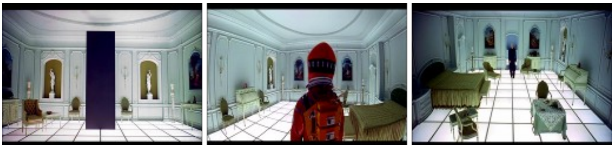
Ilustración 7. 2001, una odisea en el espacio : sala de espera más allá del infinito

En agosto de 1997 abrió sus puertas al público el que era hasta hace poco el más grande museo ufológico abierto al público, UFOland, sito en Le Jardin du Prophète, una finca de 15.000 hectáreas propiedad del MRI en Valcourt, Quebec, a dos horas en coche desde Montreal. Según explicaba a los