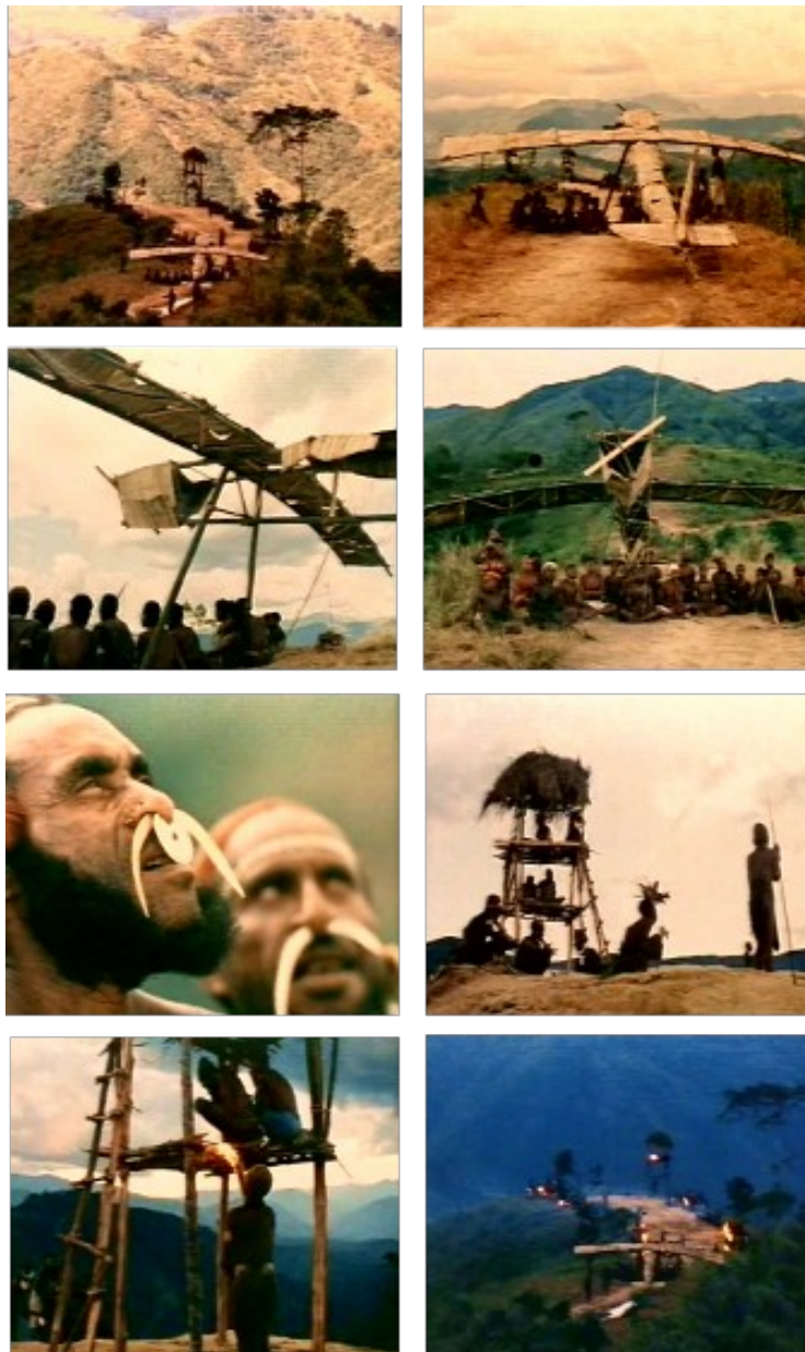
Ilustración 2. Mondo Cane : el Cargo Cult

El cambio de imagen nos traslada a una zona cercana, la cima de una montaña en un sistema de cordillera, a más de tres mil metros sobre el nivel del mar, donde el grupo anterior de espectadores ha construido la más alucinante catedral: un aeropuerto de Bambú. El aeropuerto consta de una maqueta-señuelo, un prototipo vegetal de una avioneta posible colocado al inicio de un camino de tierra despejado por la mano del hombre que semeja ser una pista de aterrizaje. En el otro extremo de la pista hay una construcción elevada hecha con los mismos materiales –bambú, lianas– que parece la torre de control del aeropuerto. Prosigue la voz del narrador, que acompaña a las imágenes con estas palabras: