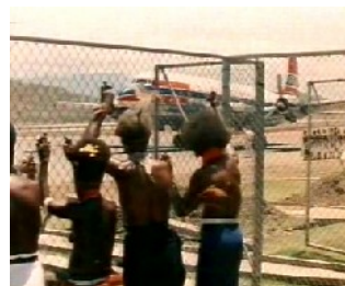
Ilustración 1. Mondo Cane : aeropuerto de Port Moresby, Nueva Guinea australiana

Es aquí, a las puertas del aeropuerto de Port Moresby, donde el viaje aborígen a través de los tiempos toca a su fin. Es justo aquí donde, no encontrando una razón para todas las cosas que han pasado