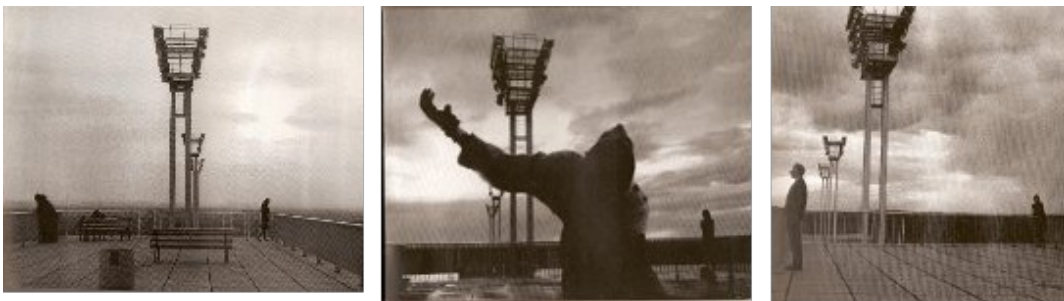
Ilustración 6. La Jetée : sala de embarque ominosa