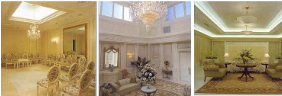
Ilustración 5. Templo Mormón de Madrid: sala de sellamientos, sala celestial y sala de espera

artista Chris Marker como la ominosa terminal de embarque aeroportuaria de su filme La jetée (1962) (vid. Marker, 1962/2008). 17