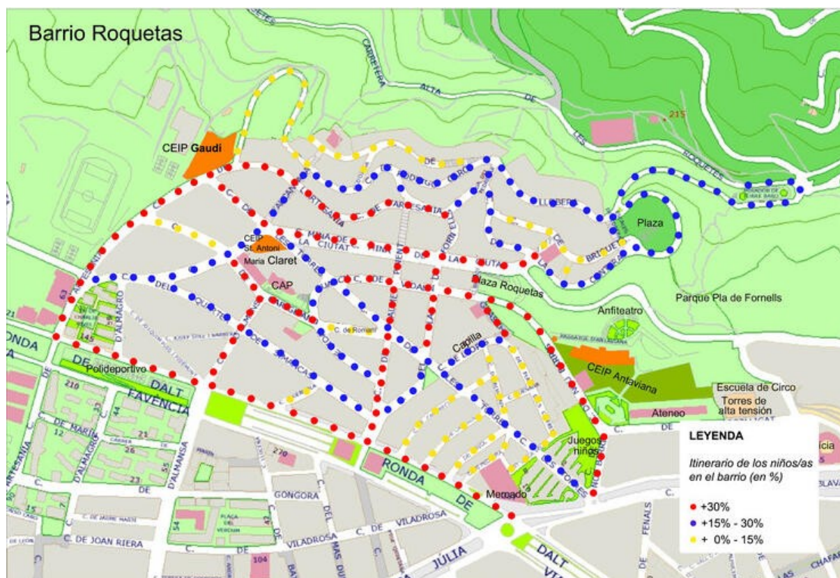
Figura 2. Mapa resumen de los itinerarios de los estudiantes de los tres colegios de Roquetes