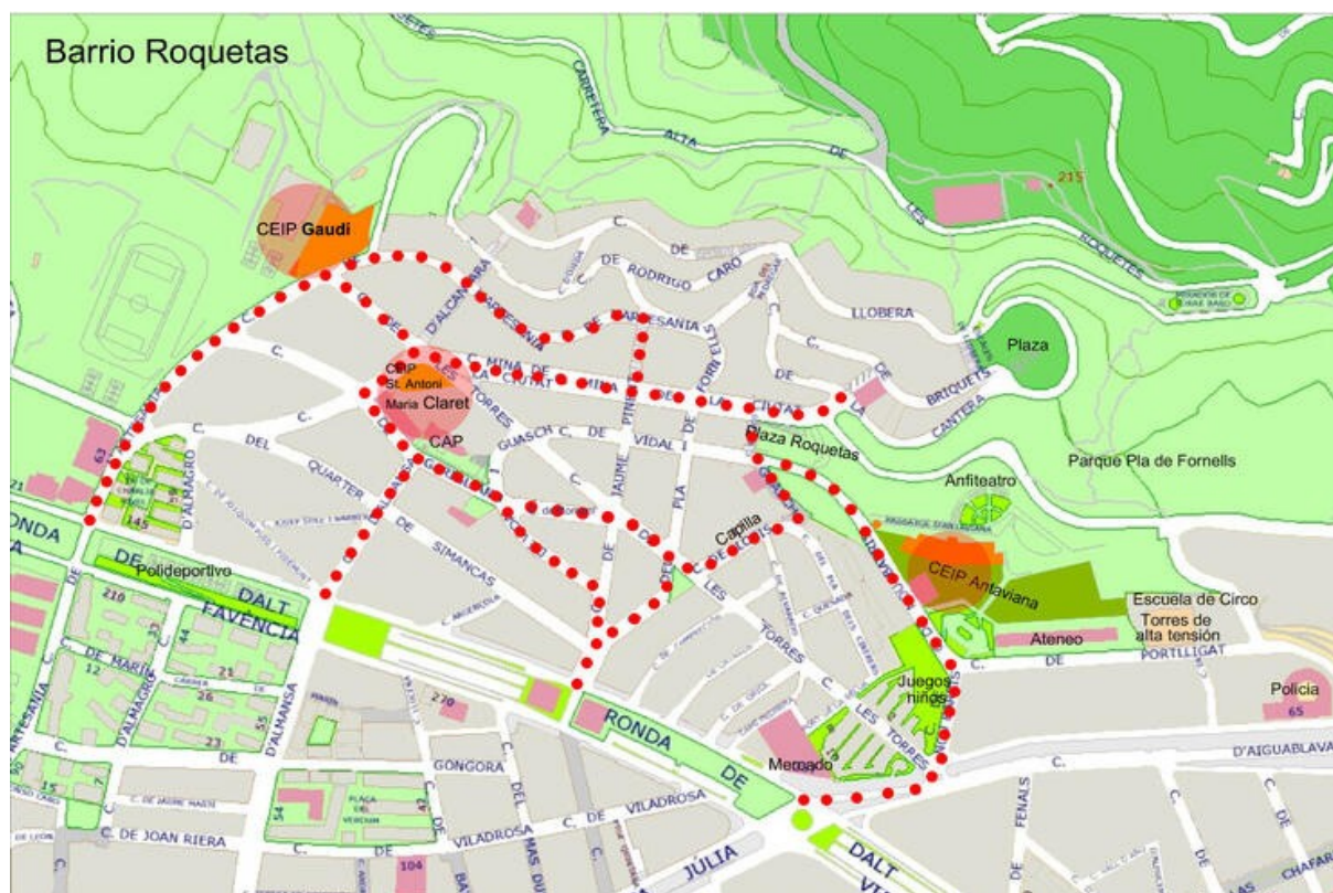
Figura 4. Mapa propuesto de Los Caminos de los Niños y Niñas de Roquetes

La identificación de puntos de riesgo permite la atención sobre los posibles riesgos de niños y niñas al caminar en el barrio y las posibles líneas de actuación que se pueden proponer a la administración pública y a la comunidad.