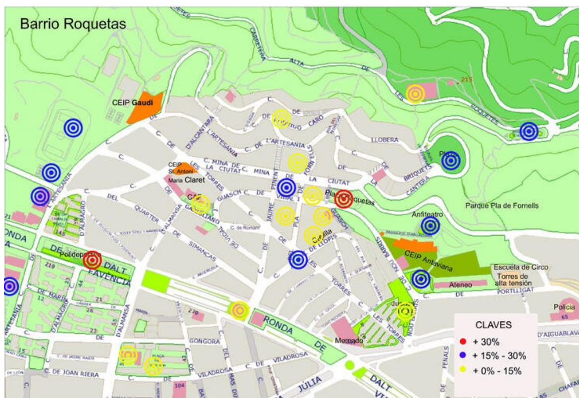
Figura 1. Mapa resumen de los lugares de relación de los CEIPs Antaviana, Gaudí y Sant Antoni María Claret