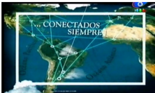
Figura 9. Fotograma del comercial de Movistar.