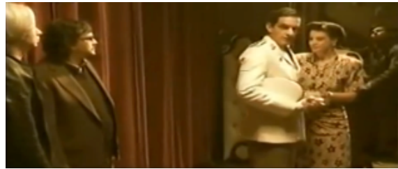
Figura 31. Fotograma con la caracterización de Evita. Fuente: Pergolini, 2007-2008, capítulo XII, temporada 3.

que cerraría la historia de las élites, trastocándola en “historia de protagonistas complejos e imprevisibles: las masas, el pueblo, la gente, los argentinos”.