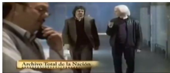
Figura 18. Rótulo sobreimpresionado: Archivo Total de la Nación. Fuente: Pergolini, 2007-2008, capítulo XII, temporada 3.

El personaje del archivero evidenciaba, por su parte, el estereotipo de lo común ordinario, en este caso personalizando la mediocridad de la memoria oficial esclerotizada. Y permitía en algunos momentos, incluir y adelantar acontecimientos (ver figura 18), siempre desde un tono irónico y humorístico.