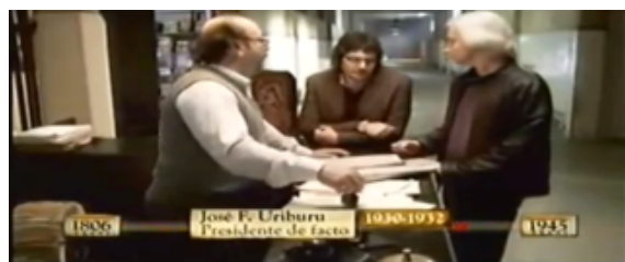
Figura 19. Rótulo sobreimpresionado: José F. Uriburu (1930-1932).

Los rótulos, en la parte inferior de la pantalla (ver figura 19), permitían la rápida ubicación del espectador en una etapa temporal precisa: la presidencia de José F. Uriburu (1930-1932), ubicada en un intervalo más amplio (1806-1945).