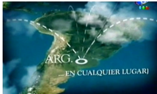
Figura 8. Fotograma del comercial de Movistar.