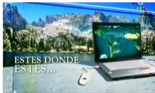
Figura 10. Fotograma del comercial de Movistar.