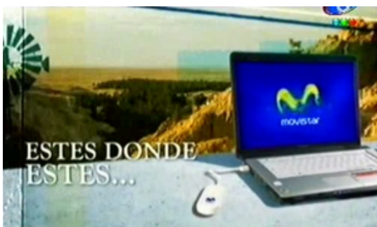
Figura 11. Fotograma del comercial de Movistar.