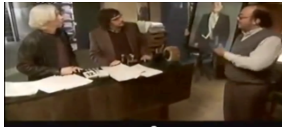
Figura 23. Presidentes electos entre 1938-1942.

Frente a esa imagen gris del conservador del pasado, el capítulo exaltaba otras figuras mediante una humanización radical, siguiendo la máxima de que la “historia se hace hombre”. Esta estrategia era complementaria a las alusiones al pueblo, la masa, los ciudadanos o la gente corriente. Algo habrán hecho (...) daba relieve a los héroes —como Lisandro de la Torre, el prototipo de servidor público—, frente a los traidores o violentos. Julio Roca, firmante del acuerdo preferencial