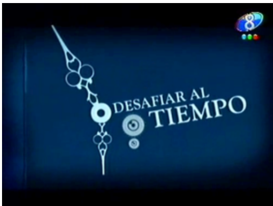
Figura 7. Fotograma del comercial de Movistar.