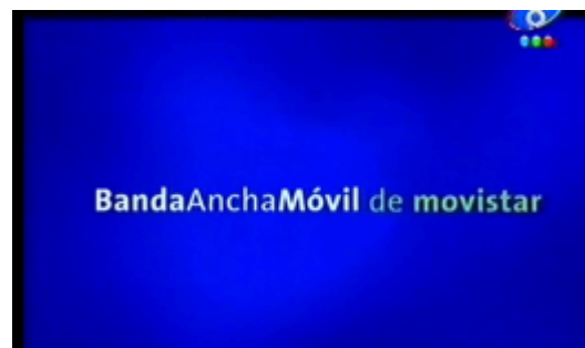
Figura 12. Fotograma del comercial de Movistar.

En el segundo spot (Ford, 2008): Ford Ranger y Ford F-100, aparecían varios rótulos sobrepresionados en imágenes de diferentes modelos de automóviles : “con los argentinos”, “en cada momento”, “y en cada lugar”, “en que se construye la historia”, “Ford Ranger”, “Ford F-10”, “0 kilómetros de historia”.