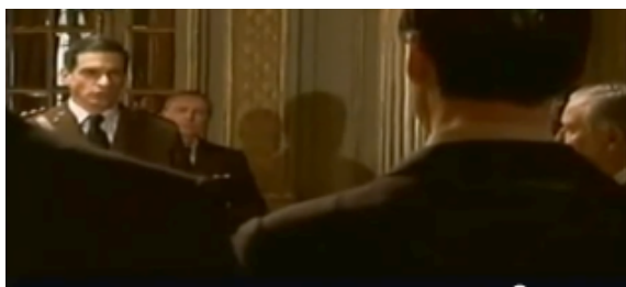
Figura 25. Fotograma con la caracterización de Juan Domingo Perón. Fuente: Pergolini, 2007-2008, capítulo XII, temporada 3.

con Gran Bretaña en 1933, era presentado como una prefiguración del neoliberalismo menemista. Héctor Benigno Varela, responsable de la sangrienta represión en la Patagonia, como una anticipación del terrorismo de Estado iniciado en 1976. Sólo Juan Domingo Perón se caracterizaba de modo ambiguo: por un lado, como responsable de medidas sociales (la rebaja de alquileres,