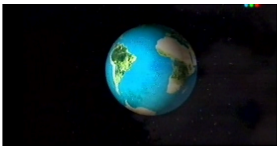
Figura 2. Prólogo. Fuente: Pergolini, 2007-2008, capítulo X, temporada 3.

nectar el reconocimiento individual con ciertas claves comprensivas o simbólicas vinculadas al pasado. En este eje se situaría, de modo destacado, la idea de espacio nacional argentino entendido como ámbito con carga identitaria y de reconocimiento, cuyo potencial de pasado es reelaborado y actualizado desde el relato televisivo de presente.