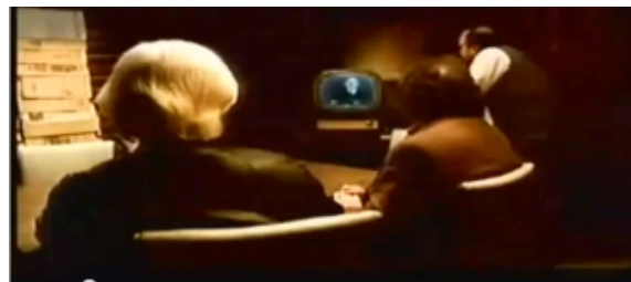
Figura 32. Fotograma de los personajes viendo la televisión. Fuente: Pergolini, 2007-2008, capítulo XII, temporada 3.

Fue, ante todo, un relato de memoria fundado en la interacción entre referencia histórica y presente. Esta naturaleza quedó manifestada mediante la reiterada estrategia de (con)fundir tiempos distantes (ayer/hoy), a través de recursos como la superposición de citas temporales en un mismo encuadre, el uso de postproducción y gráficos explicativos, o mediante el uso de la voz narrativa y comentarios over/in/off . Otra tendencia recurrente fue la alusión a medios de comunicación populares, como la radio o la televisión (ver figura 32), lo cual evidenciaría un claro interés autorreferencial.