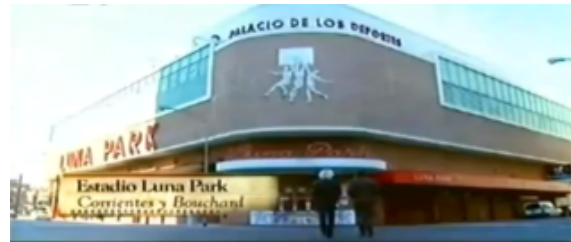
Figura 3. Estadio Luna Park. Fuente: Pergolini, 2007-2008, capítulo XII, temporada 3.

Es importante citar que, cada vez que aparecía una nueva localización, ésta venía acompañada por un rótulo con su ubicación exacta en la Argentina de 2005 (ver figura