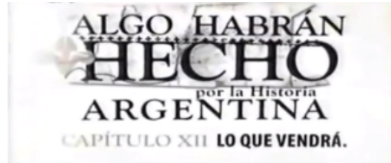
Figura 1. Título de la serie. Fuente: Pergolini, 2007-2008, capítulo XII, temporada 3.

Una de las más destacables, como ha podido observarse en el fragmento anterior, fue el uso de códigos gráficos —títulos de crédito y rótulos sobreimpresos—. El propio título del espacio (ver figura 1 2 ): Algo habrán hecho (por la historia argentina) —en tipografía de mayor tamaño— y más allá de ubicarlo en la tradición de un determinado género (el documental), sirvió como alusión a una expresión popularizada durante la dictadura militar, que pretendía justificar de algún modo la represión emprendida desde el terrorismo de Estado.